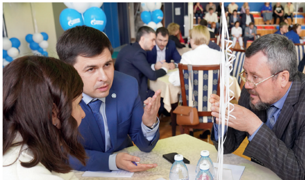
Команда победителей (факультет нефтегазовой инженерии СКФУ)

... и чем связаны между собой Год семьи и Всемирный день охраны труда. На эти и другие нестандартные вопросы ответили участники краевого тематического ивента в гостях у газовиков.