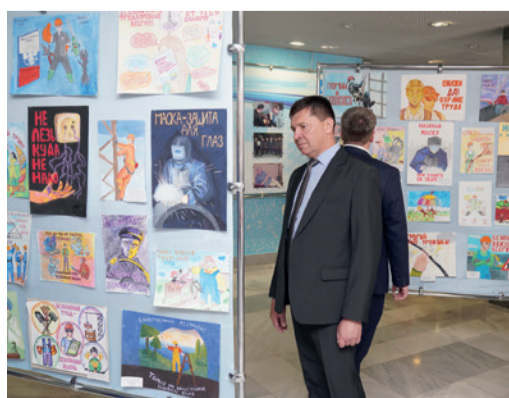
Выставка плакатов и рисунков

Кстати, известный писатель Франц Кафка в начале XX века работал в страховой компании, где постоянно сталкивался со случаями травматизма на производстве. Чаще всего фиксировали падения с лестниц и обвалы строительных конструкций. Трагедии рабочих натолкнули писателя на изобретение, которое и по сей день спасает миллионы жизней, — защитную каску. Теперь логическая цепочка «запущена» и у читателей «Газового форпоста». А значит охрана труда будет еще эффективнее!