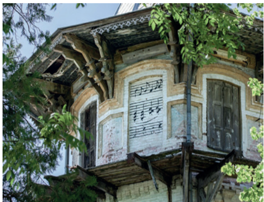
Музыкальный фасад дома

Дача находится в красивом, почти сказочном лесу. В 1998 году по распоряжению губернатора Ставропольского края эта территория получила статус «Государственный природный заказник краевого значения». Заказник был создан для сохранения и воспроизводства на его территории редких растений.