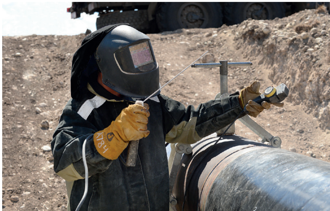
Настройка силы подачи тока перед сваркой

С приходом теплого времени года у газовиков началась жаркая пора. Масштабные ремонтные работы развернулись в зоне ответственности Невинномысского управления — на газопроводе-отводе к тепличному комбинату «Южный».