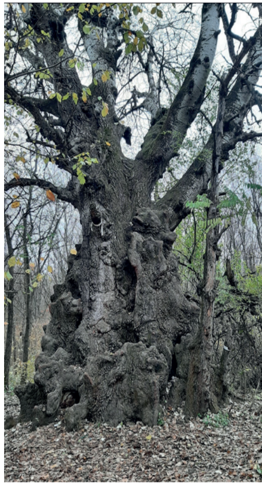
Легендарный серебристый тополь

Туристов привлекает не только оригинальная архитектура дома и история его владельцев. Одна только дорога к даче — наполненная ароматами душицы и зверобоя, по пешеходному мостику через Подку-