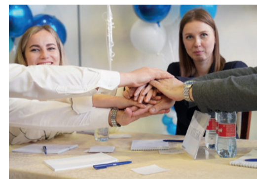
Один — за всех, и все — за одного!

манд, представлявшей Федерацию профсоюзов Ставропольского края, — «Невинномысский Азот».